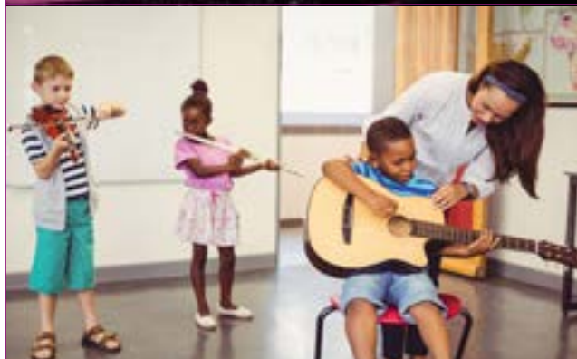
Classe de musique :