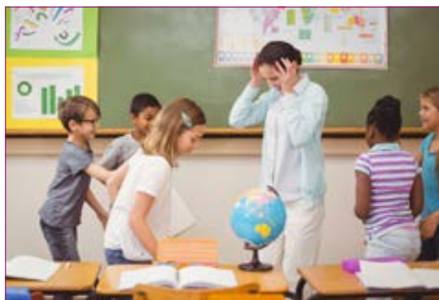
Salle de classe bruyante :