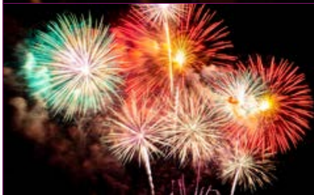
Feu d'artifice :