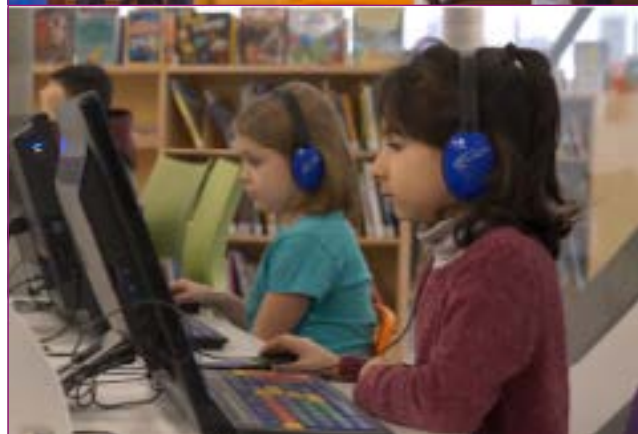
Utilisation des écouteurs ou de casques à volume élevé (musique, en classe, jeux vidéos, etc.) :